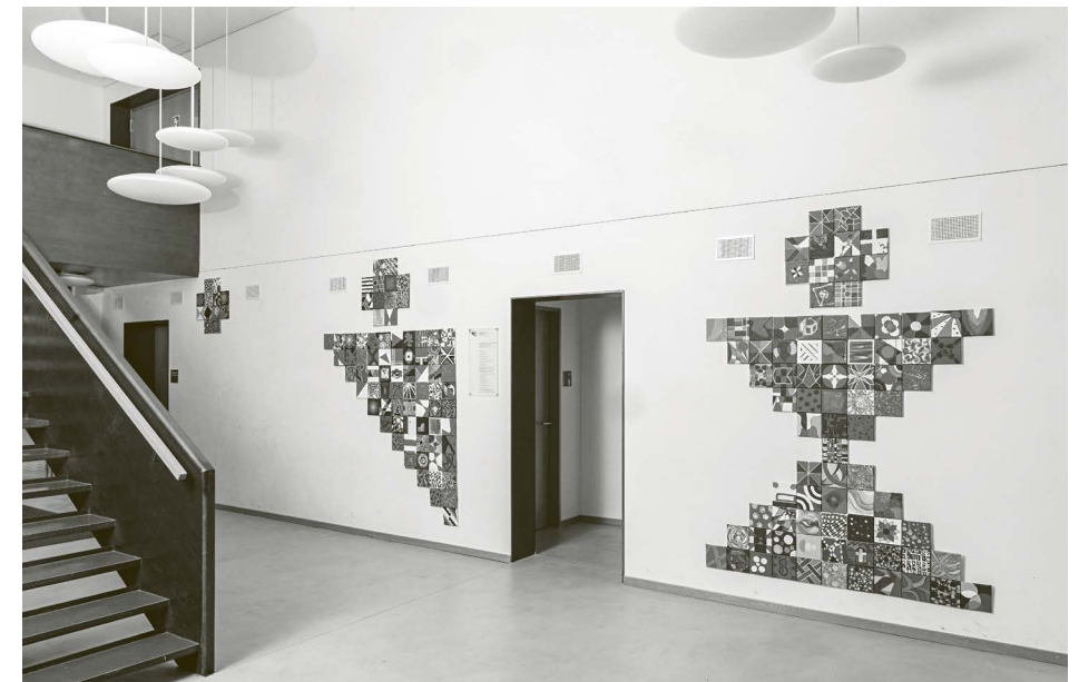
Unser Gemeinschaftsprojekt zum 125-jährigen Jubiläum: Die 100 individuell bemalten kleinen Leinwände bilden zusammen das PZP-Logo.

Neben den Feierlichkeiten beschäftigten wir uns auch in diesem Jahr mit dem pädagogischen Konzept «Neue Autorität». Die Teams der Wohngruppen und Schulen haben sich mit den daraus hergeleiteten sieben Säulen auseinandergesetzt, einzelne Schritte diskutiert und im Alltag erprobt. Die Theorie wurde gefestigt – auch Dank