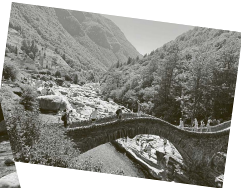
Die Kinderwohngruppe Lindenhof genoss im Tessin bei viel Sonnenschein das kühlende Wasser der Verzasca.