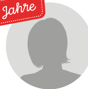
SILKE STURM UMBRICHT Sozialpädagogin Wohngruppe Felsenhof