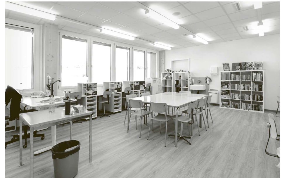
Die neuen Räumlichkeiten in Baltenswil überzeugen durch ihre Funktionalität und ihre angenehme Atmosphäre.

Der gesamte Prozess war von Rückschlägen, Verzögerungen und Anpassungen geprägt, die Flexibilität, Ausdauer und pragmatische Lösun-