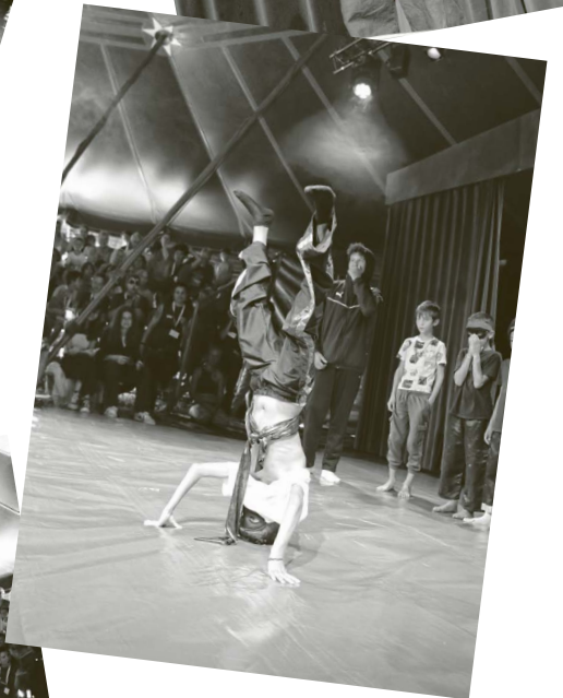
Der Höhepunkt der Zirkuswoche war die Aufführung am Jubiläumsfest des PZP. Vor zahlreichem Publikum durften die Kinder und Jugendlichen ihre eingeübten Kunststücke präsentieren.